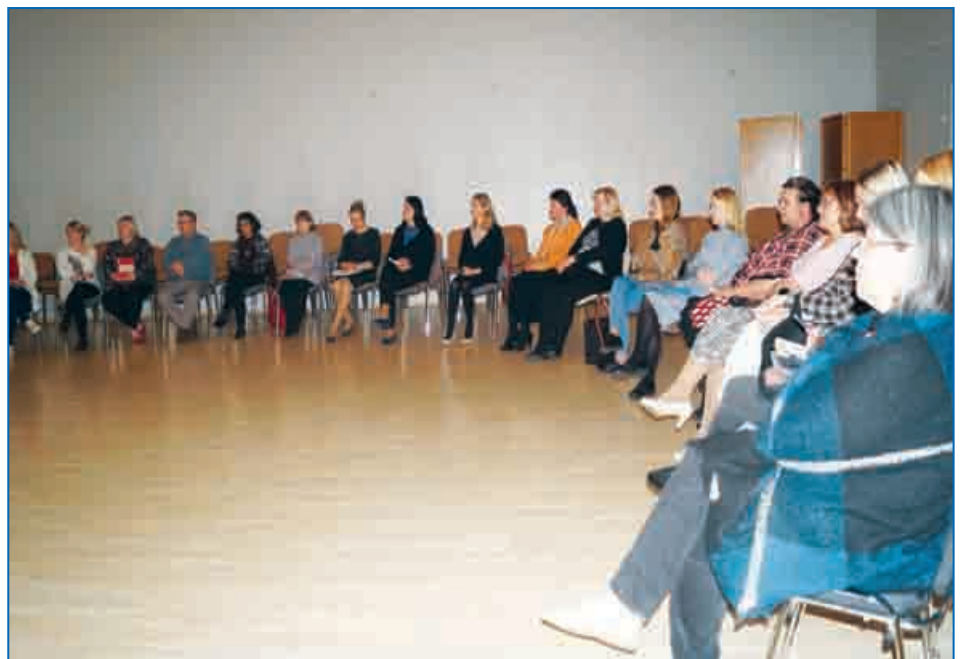
Фото со встречи с педагогическим коллективом Эстонской основной школы.