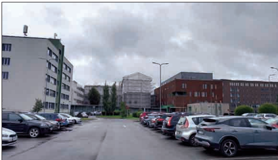
После переезда стационара уездной больницы в новый корпус (справа) бывший стационар (в центре) перестраивают под амбулаторные приёмы.

- Но в школах же, например, анализируют, сколько у них педагогов собирается на заслуженный отдых