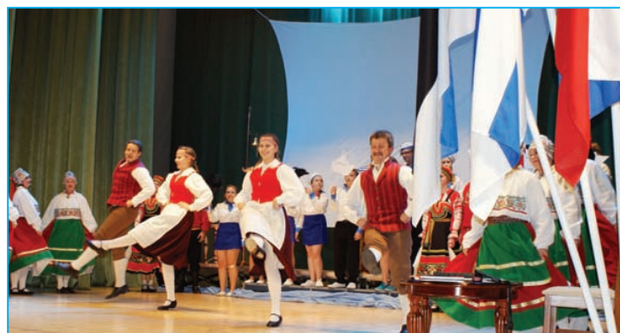
В зале и на сцене.