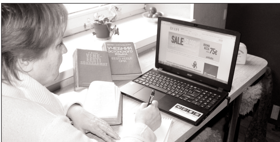
Иллюстративное фото автора.

Учить государственный язык живущим в Эстонии и несобирающимся её покинуть - жизненная необходимость. Английский и русский важны, особенно, если человек работает в предприятии, имеющем так или иначе деловые контакты со странами, где они активно используются в качестве языков международного общения. Существует и группа людей, которым учить языки просто интересно.