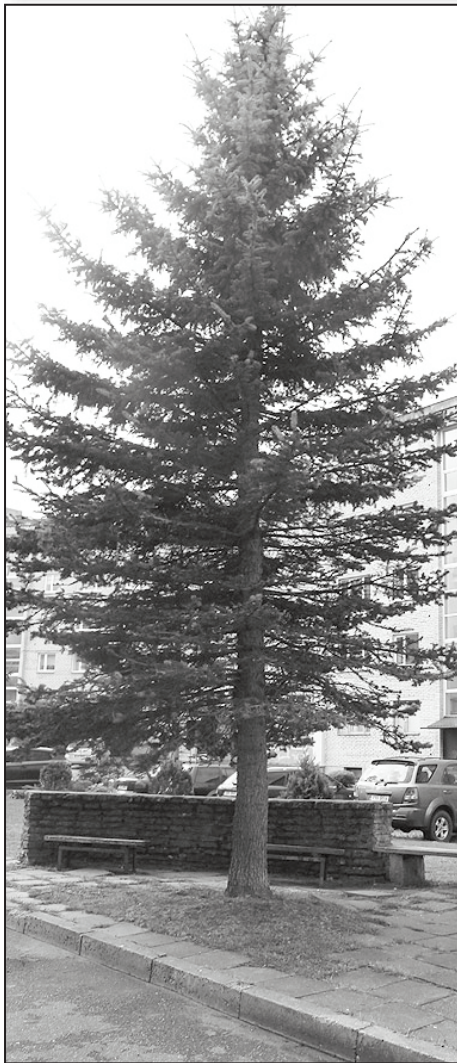
Большинство и меньшинство