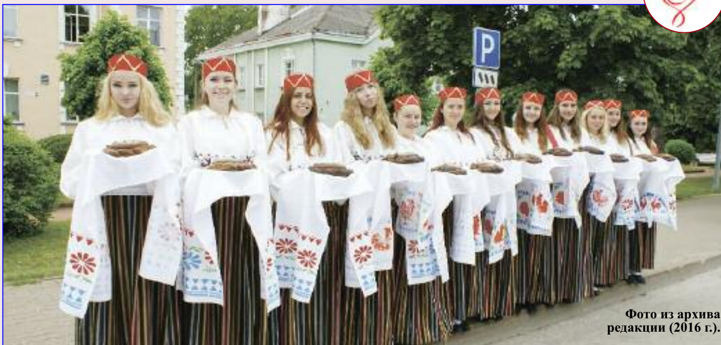
Фото из архива редакции (2016 г.).

Оргкомитет праздника приглашает всех жителей города и его гостей 25 и 26 мая на праздник «Культурные мосты Балтики». Зарубежные коллективы из Республики Беларусь, России, Украины, а также эстонские группы из Рапла и Ида-Вирумаа, силламяэские артисты - танцевальные ансамбли «Сувенир», «Антре», вокальный ансамбль «Русичи», ансамбль украинского землячества «Водограй», ансамбль барабанщиков «Улья», инструментальный семейный квартет Хадзараговых из музыкальной школы сплетут на празднике красивейший многоцветный «веночек» из песен, танцев, музыки.